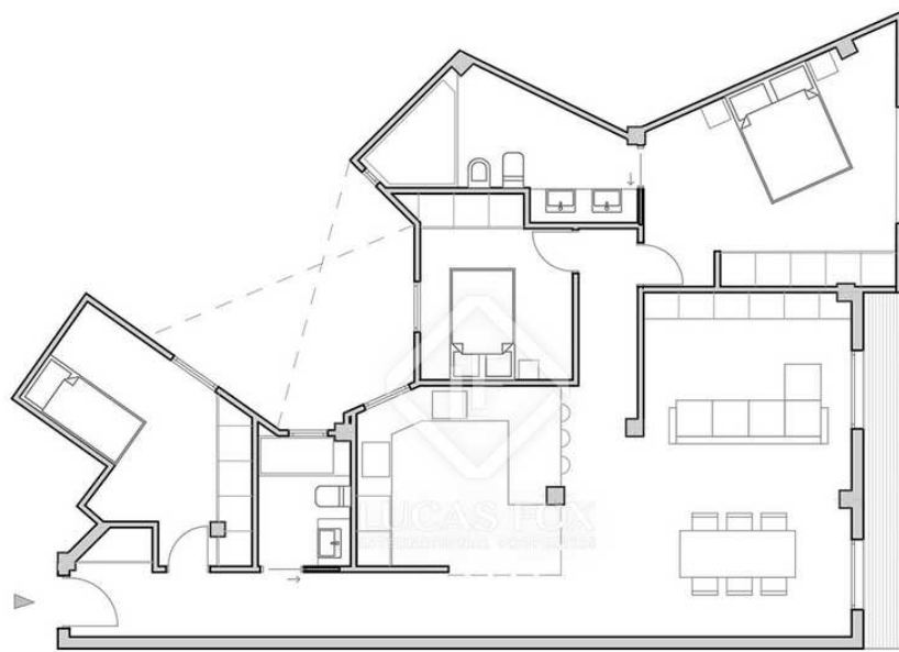
PROPUESTA DE REFORMA