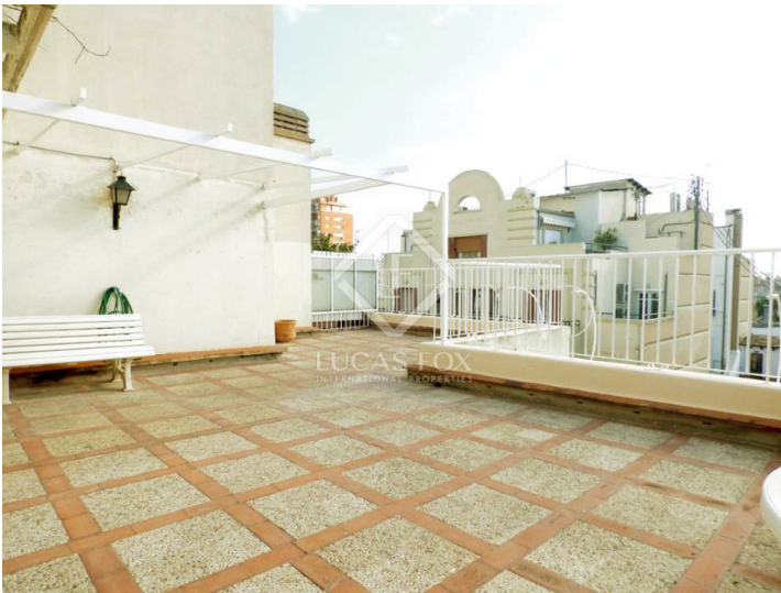
PROPUESTA ATICO DUPLEX