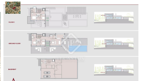
CATVARAH VILLA 4

Contactez-nous à propos de cette propriété