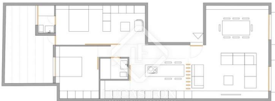
PLANO DE PROYECTO

Важная информация о недвижимости от компании Lucas Fox. Любая информация об объектах недвижимости не носит договорного характера и не является юридически точной. Не следует принимать на веру заявления компании Lucas Fox, представленные в устной или письменной форме, касающиеся детальной информации об объекте недвижимости, его состоянии или его оценочной стоимости. Компания Lucas Fox и ее агенты не уполномочены делать заявления об объектах недвижимости. В следствии этого, агенты, продавцы и арендодатели не несут ответственности за предоставленную информацию. Прежде чем подписывать любые документы, касающиеся купли-продажи объекта недвижимости, мы рекомендуем обратиться за консультацией к независимому юристу и, в случае необходимости, провести экспертизу объекта недвижимости для установления его точных размеров и состояния.