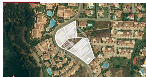
TRYAH VILLA 3 • LOCATION

1000m 100m 50m 20m 10m 5m 2m 1m 0.5m 0.2m 0.1m