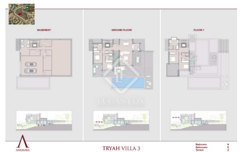
TRYAH VILLA 3

1000m 100m 50m 20m 10m 5m 2m 1m 0.5m 0.2m 0.1m