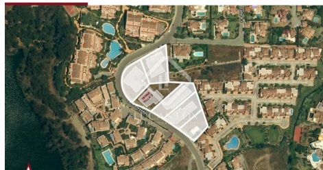
TRYAH VILLA 3 • LOCATION