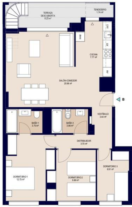
OPCION BASE 1 : 75