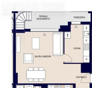
OPCION COCINA CERRADA 1 : 100