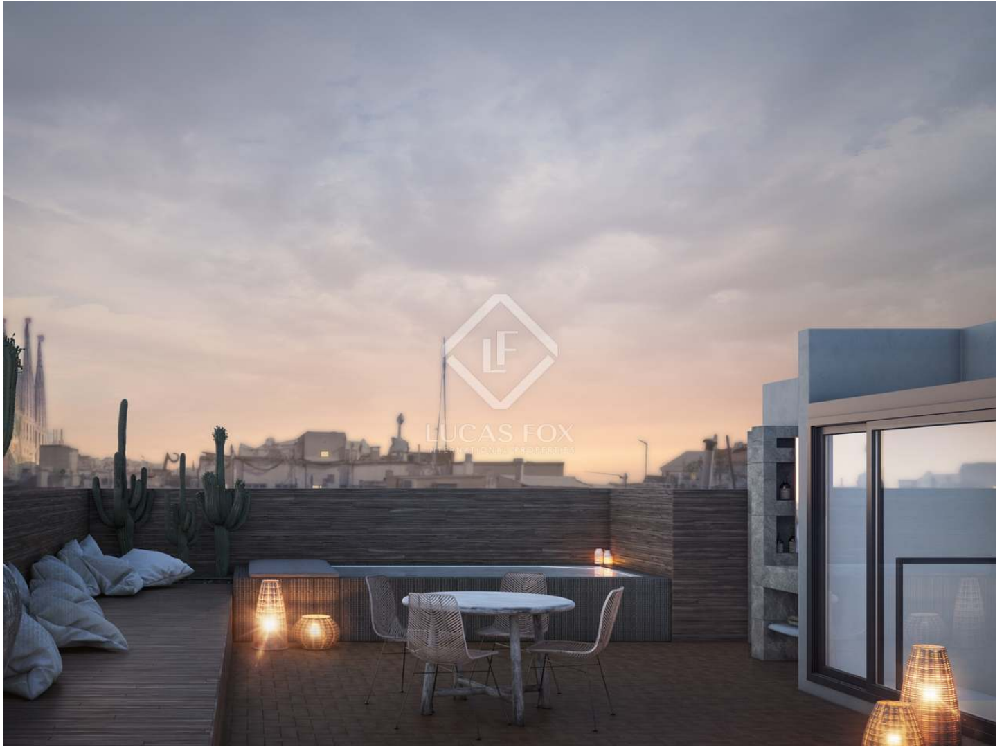
ELL DE CENT USE 1

3 Dormitoris 3 Cambres de bany 158m 2 Edificats 70m 2 Terrassa