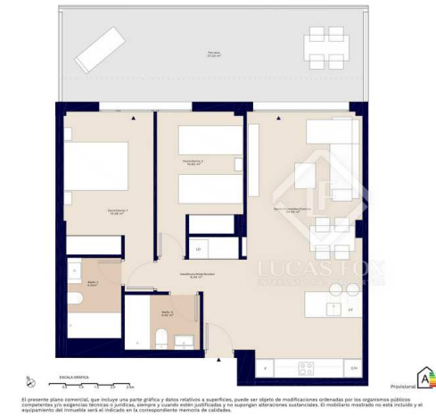
Bloque 1 Esc. 2 P04 D