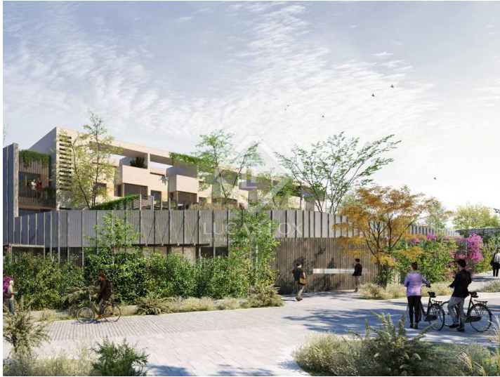
Vivienda B, C, D

5 Dormitoris 4 Cambres de bany 300m 2 Plànol 175m 2 Dimensions del terreny 66m 2 Terrassa 48m 2 Jardí