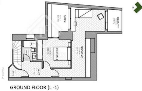
GROUND FLOOR (L -1)