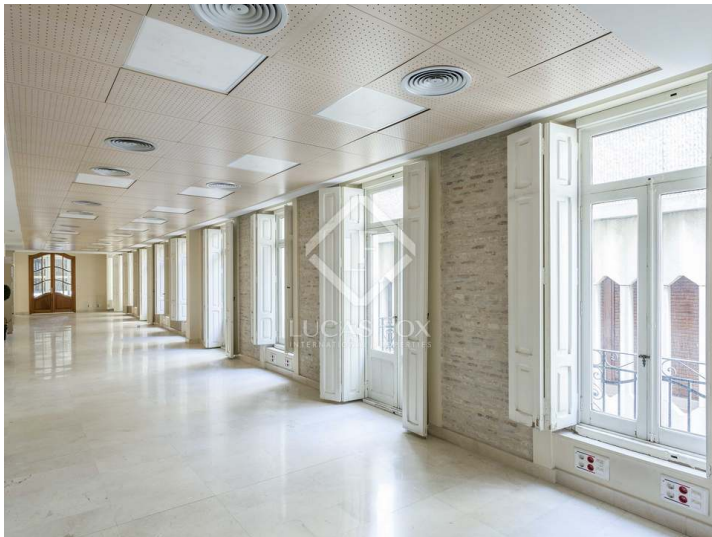
Propuesta de reforma