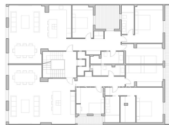
PROYECTO SEGREGACIÓN Se plantea en este caso tres alternativas y orientaciones para representar una posible segregación interior. No constituye un documento definitivo para ejecución de obra. El precio, cantidad, valoración y condiciones algunas, y se debe utilizar como base para la toma de decisiones técnicas y jurídicas.

Dils Lucas Fox (Lucas Trading, SL) consta inscrita al Registre d'Agents d'Intermediació Immobiliària de la Comunitat Valenciana amb número RAICV 4243.