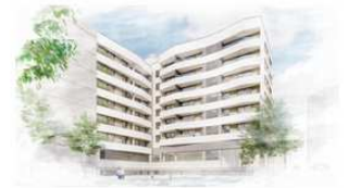
Portal 2. P1-E 3D