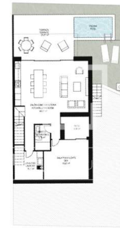
PLANTA BAJA GROUND FLOOR