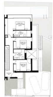
PLANTA PRIMERA FIRST FLOOR