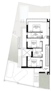
PLANTA PRIMERA FIRST FLOOR