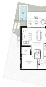
PLANTA BAJA GROUND FLOOR