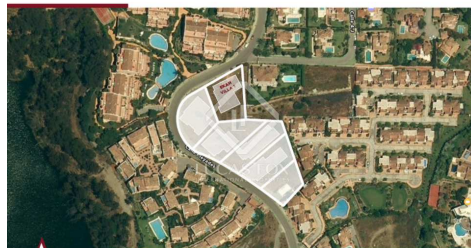
EKAH VILLA 1 - LOCATION