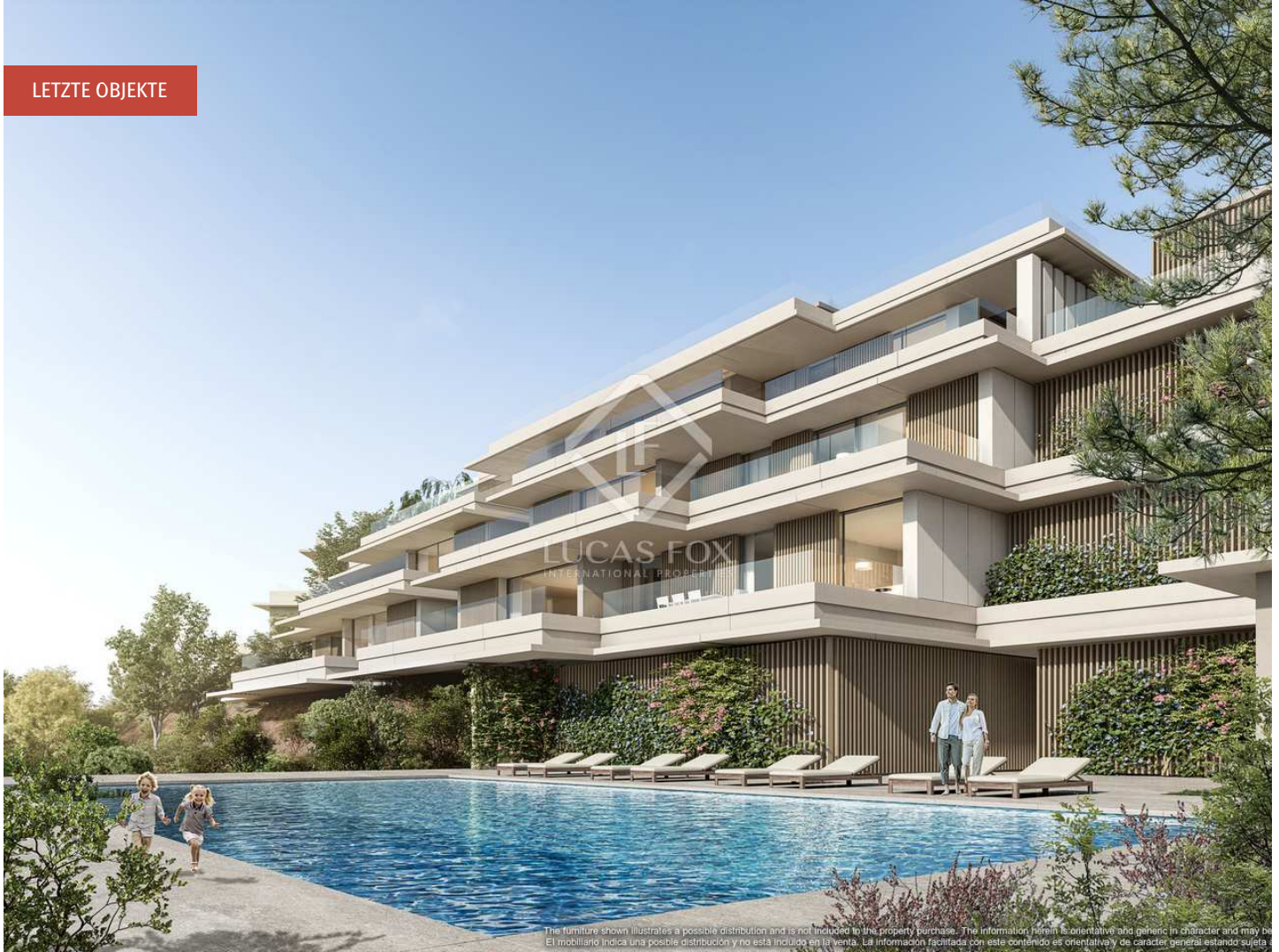
The furniture shown illustrates a possible distribution and is not included in the property purchase. The information herein is orientative and generic in character and may be subject to change. El mobiliario indica una posible distribución y no está incluido en la venta. La información facilitada con este contenido es orientativa y de carácter general, estando sujeta a modificaciones.

Q2 2024 1 3.0 480m 2 Erteilt Fertigstellung Verfügbare Einheiten Schlafzimmer Größen ab Baugenehmigung