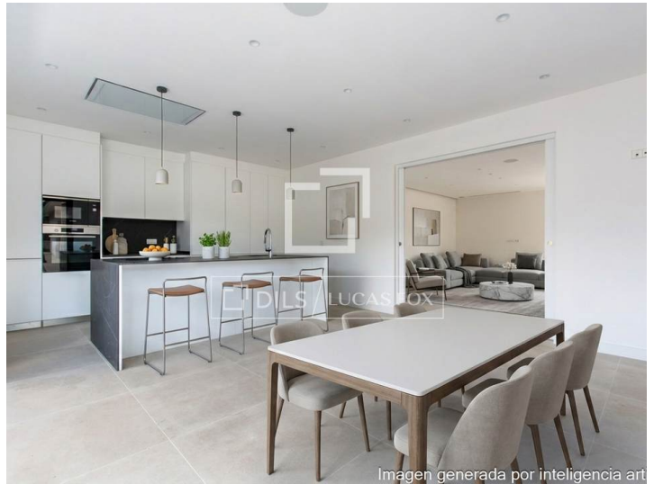
Imagen generada por inteligencia artificial

Wichtige Informationen über die von Lucas Fox angebotenen Immobilien. Sämtliche Immobilienbeschreibungen stellen kein Angebot oder Vertrag oder einen Teil davon dar. Sie sollten nicht auf die sachliche Richtigkeit der von Lucas Fox dargestellten Angaben in Immobilienbeschreibungen und der durch Lucas Fox mündlich oder schriftlich erteilten Informationen in Bezug auf die Immobilie, ihren Zustand oder Wert vertrauen. Weder Lucas Fox noch ein zugehöriger Agent sind befugt, Darstellungen über die Immobilie zu veröffentlichen. Diesbezüglich übernehmen weder die Agenten noch der/die Verkäufer oder Vermieter Verantwortung. Vor der Unterzeichnung von Dokumenten in Bezug auf die Immobilie, empfehlen wir allen Käufern, einen unabhängigen Anwalt zu konsultieren und gegebenenfalls ein Immobiliengutachten zur Prüfung des Bauzustands und der Abmessungen durchzuführen. Alle Flächen-, Mass- und Entfernungsangaben gelten als ungefähre Angaben und sollten vom Käufer geprüft werden.