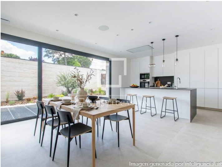
Imagen generada por inteligencia artificial