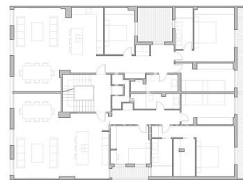
PROPUESTA SEGRIGACIÓN Los planes se realizan con fines informativos y orientativos para representar una posible segregación interior. No constituyen un documento legal para efectos de venta, arrendamiento, hipoteca o cualquier otro fin, y no deben utilizarse como base para la toma de decisiones técnicas o jurídicas.

+34 960 077 790 · valencia@lucasfox.com · lucasfox.de · Calle Hernán Cortés 28, Valencia, Spanien