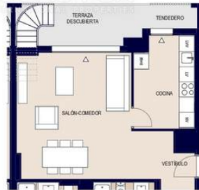
OPCION COCINA CERRADA 1 : 100