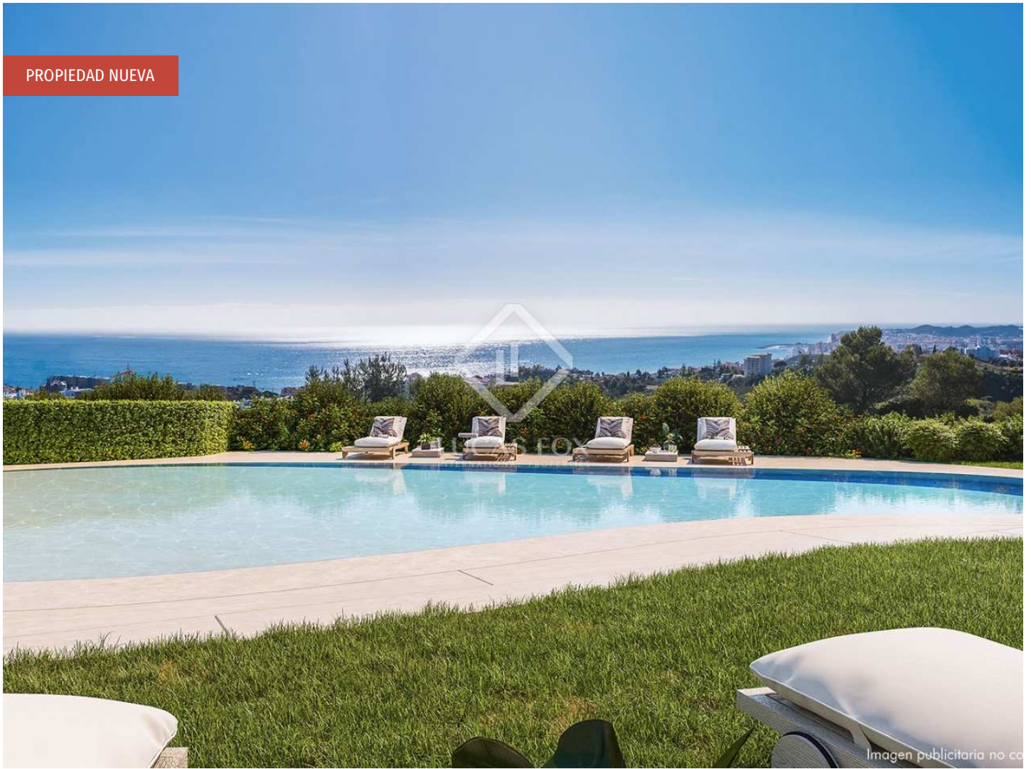
Imagen publicitaria no co