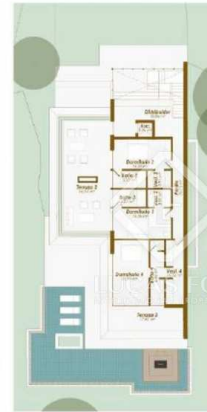
VIVIENDA 5 - Planta Alta