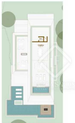
VIVIENDA 5 - Solarium