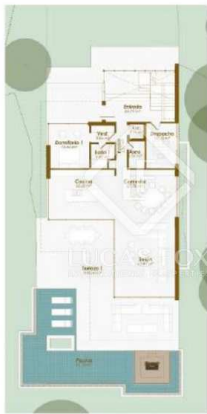
VIVIENDA 5 - Planta Baja

4 Dormitorios 357m 2 Plano 1.157m 2 Tamaño parcela 370m 2 Terraza