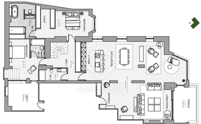
PROJECT OP. 1