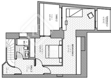
GROUND FLOOR (L -1)