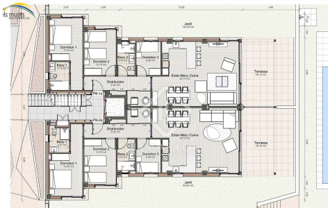
ELS MUNTIS RESIDENCIAL PLANO: PLANTA BAJA 1A 12A 10/11 000 0001 000001 11.000