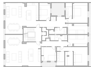
PROPOSTA SEGREGACIÓN Los planos se realicen con fines informativos y orientativos para representar una posible segregación interior. No constituyen un documento técnico para ejecución de obra, proyecto, licencia, valoración o cualquier otro fin, y no debe utilizarse como base para la toma de decisiones técnicas o jurídicas.

Dils Lucas Fox (Lucas Trading, S.L.) consta inscrita en el Registro de Agentes de Intermediación Inmobiliaria de la Comunidad Valenciana con número RAICV 4243.