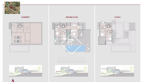
TRYAH VILLA 3

Pool Area Golf Club Beach Club Tennis Courts Swimming Pools