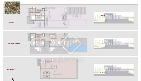
CATVARAH VILLA 4

Contactez-nous à propos de cette propriété