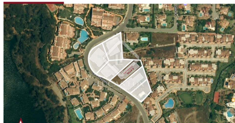
CATVARAH VILLA 4 • LOCATION