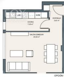
Portal 2. P3-D 3D