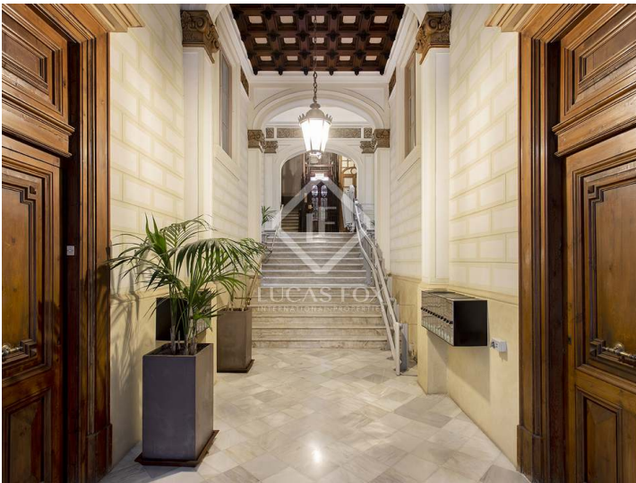
BCN20981 Propuesta 1