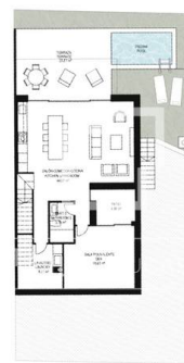
PLANTA BAJA GROUND FLOOR