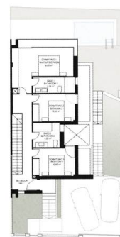
PLANTA PRIMERA FIRST FLOOR