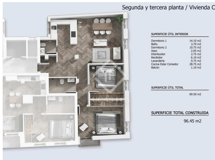
Segunda y tercera planta / Vivienda C

Information importante concernant les propriétés de Lucas Fox. Les indications sur les propriétés ne sont ni une offre ni un contrat, ni une partie d'une offre ou d'un contrat. Ne vous fiez pas aux déclarations de Lucas Fox dans les détails, par le bouche à oreille ou par écrit comme étant des faits précis sur la propriété, son état ou sa valeur. Ni Lucas Fox, ni aucun agent associé n'est habilité à représenter la propriété, et en conséquence, toute information donnée est tout à fait sans aucune responsabilité de la part des agents, vendeur (s) ou bailleur (s). Avant la signature de tout document relatif à la propriété, nous recommandons que tous les acheteurs consultent un avocat indépendant et si nécessaire, effectuent une enquête sur la propriété pour vérifier son état / ses dimensions. Les pièces, les mesures et les distances indiquées ne sont qu'approximatives et doivent être vérifiées par l'acheteur.