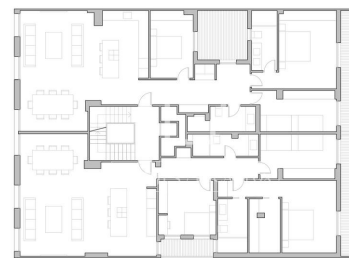
PROYUESTA SEGRIGACIÓN Los planes se realizan con fines informativos y orientativos para transparentar una posible segregación interior. No constituyen un documento técnico para ejecución de obra. Asimismo, quedan reservados todos los derechos de propiedad e imagen.

Dils Lucas Fox (Lucas Trading, SL) est enregistré au Registre des agents immobiliers de la Communauté valencienne sous le numéro RAICV 4243.