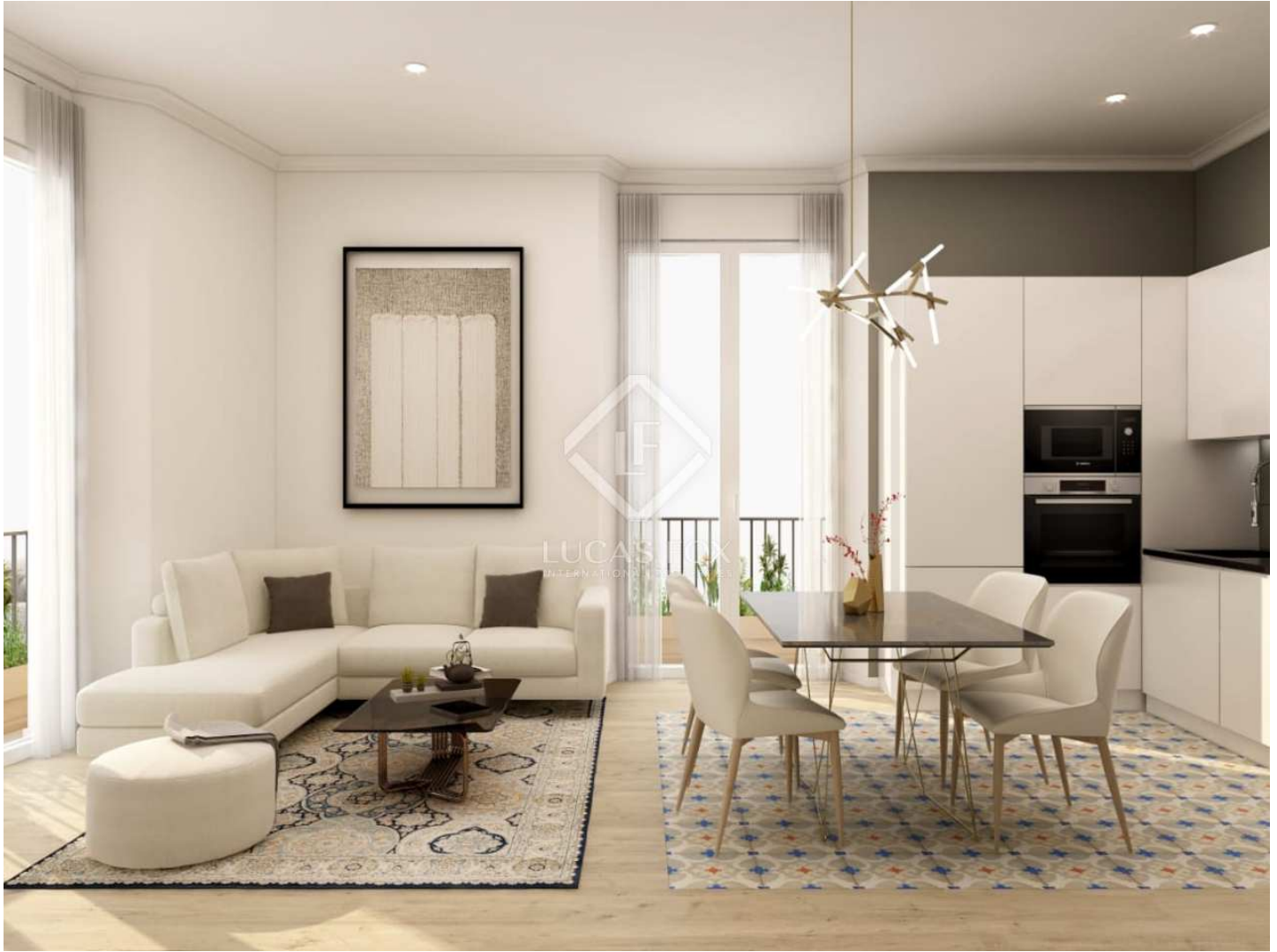
view General - Planta Terrace

2 Chambres 1 Salles de bains 76m 2 Plan 89m 2 Terrasse