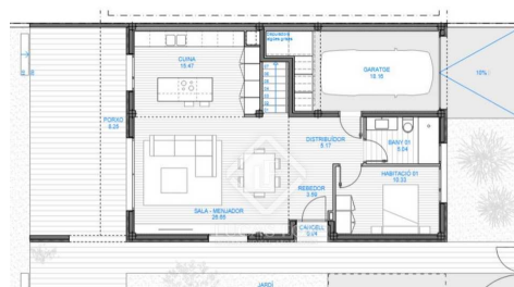
PROJETE BÀSIC D'ENDESGUÓ D'UN HABITATGE UNIFAMILIAR AMB PISCINA PLANO: PLANTILLA ESCALA: 1/100