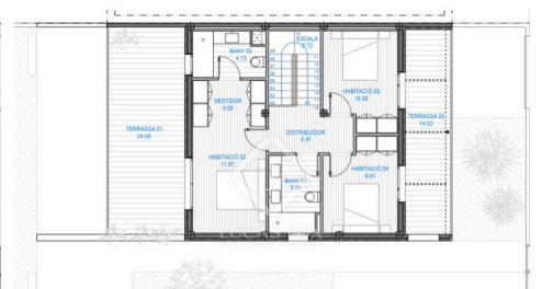
PROJETE BÀSIC D'ENDESGUÓ D'UN HABITATGE UNIFAMILIAR AMB PISCINA PLANO: PLANTILLA ESCALA: 1/100