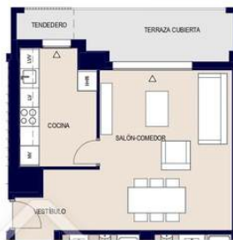
OPCION COCINA CERRADA 1 : 100