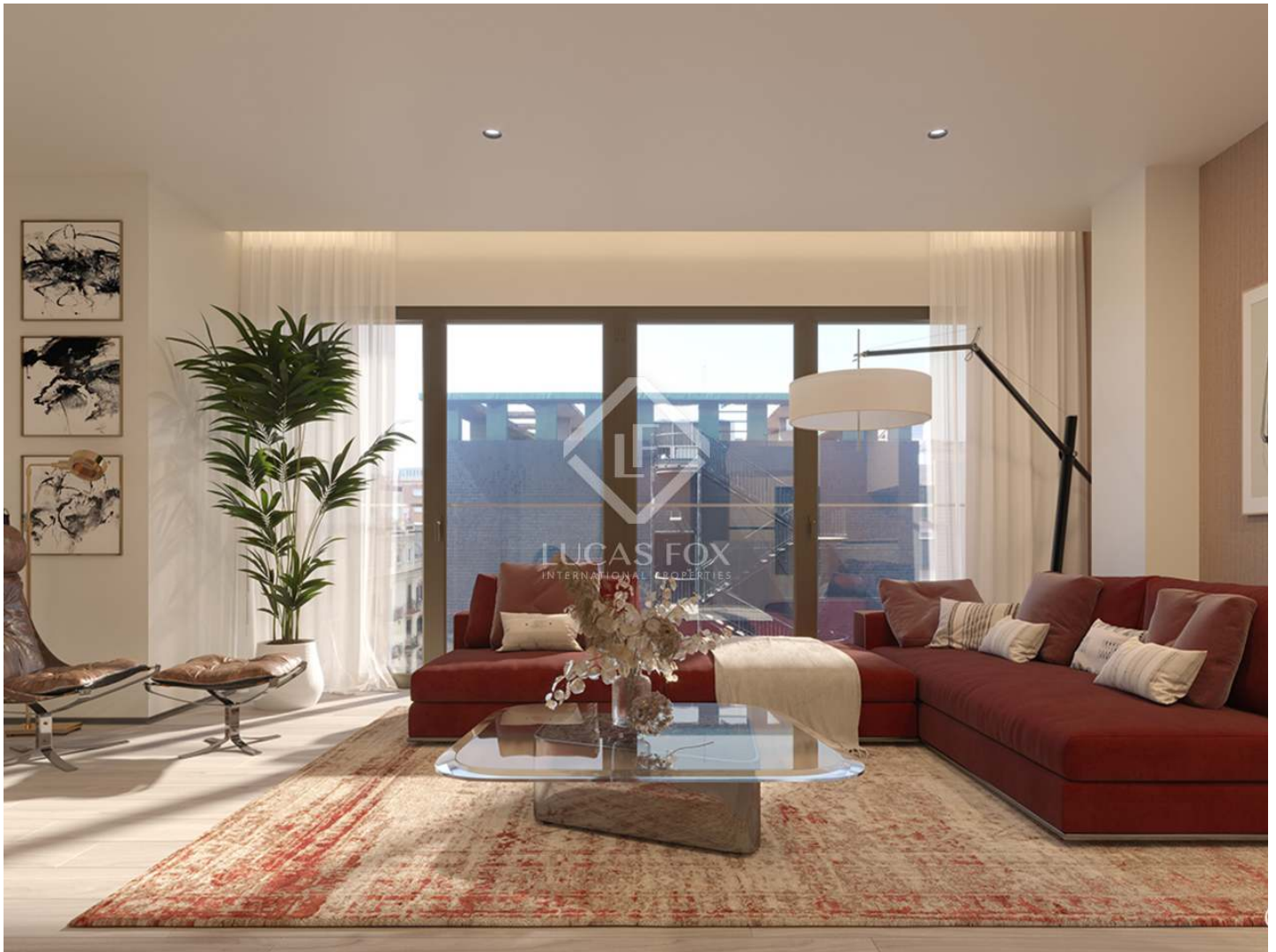
ES - SANT GERVASI RD UNIT - TYPE 4