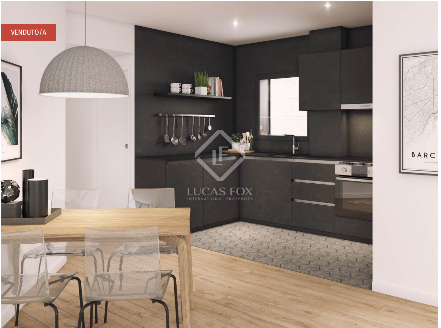
RAMON TURRÓ - ÁLABA BLOCK 91 - TYPE 3

3 Bedrooms 2 Bathrooms 94m 2 Planimetrie