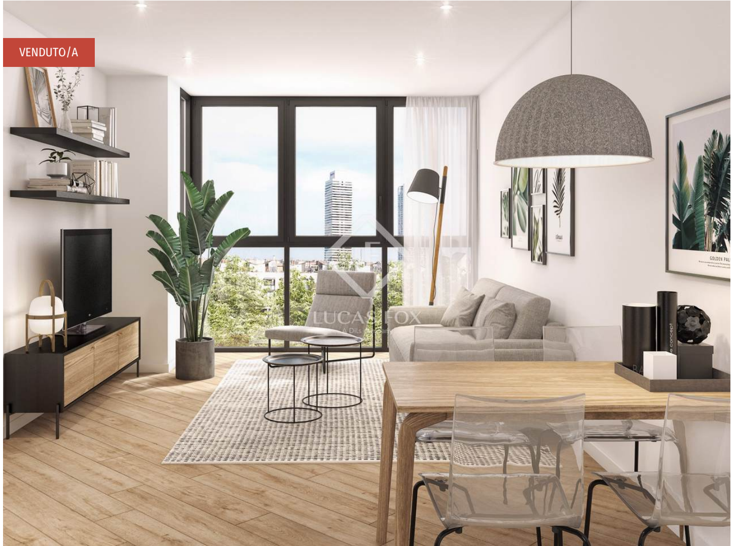
RAMON TURRÓ - ÁLABA BLOCK 91 - TYPE 1

2 Bedrooms 1 Bathrooms 66m 2 Planimetrie