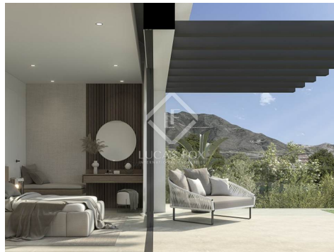
Villa ISTRIA, Santa Maria Golf, Av. Santa Maria, plot 233, Marbella. Plot area: 1.057 m 2 COSTA DEL SOL, COSTA DEL GOLF GROUND FLOOR