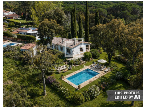
THIS PHOTO IS EDITED BY AI

In sintesi, si tratta di un'opportunità unica per investitori o privati che desiderano realizzare una casa su misura in una posizione privilegiata, coniugando tranquillità, natura e vicinanza al mare.