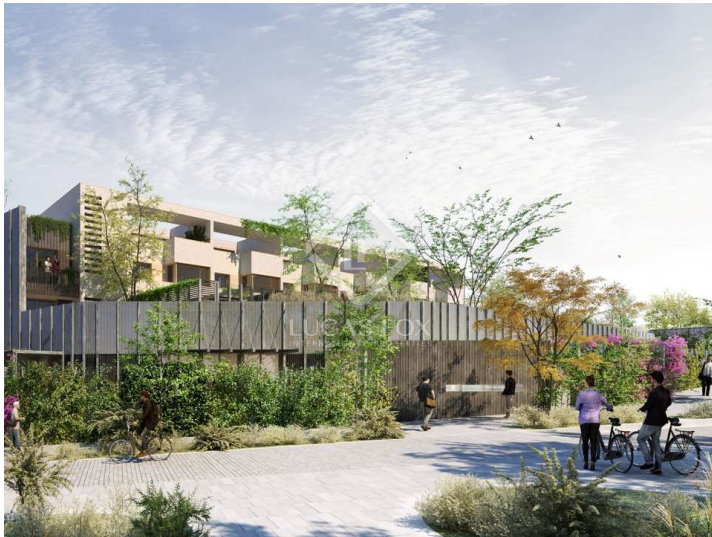
Vivienda B, C, D

5 Bedrooms 4 Bathrooms 300m 2 Planimetrie 175m 2 Plot size 66m 2 Terrazza 48m 2 Giardino