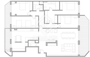
PROPOSTA DE REFORMA

La casa dispone di riscaldamento centralizzato e un garage con capacità per due auto e la proprietà dispone di un servizio di portineria.