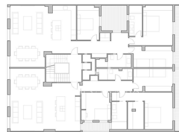
PROYUESTA SEGRIGACIÓN Este plano se realiza con fines informativos y orientativos para transmitir una posible segregación interior. No constituye un documento técnico para ejecución de obra, proyecto, licencia, valoración o cualquier otro fin, y no debe utilizarse como base para la toma de decisiones técnicas o jurídicas.

Dils Lucas Fox (Lucas Trading, SL) è iscritta al Registro degli Agenti Immobiliari della Comunità Valenciana con il numero RAICV 4243.