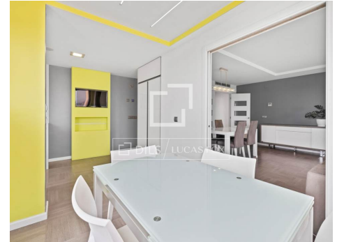
Immagine commercializzata da Dils Lucas Fox (Lucas Trading, SL, con codice fiscale B64125438), in qualità di intermediario immobiliare. Iscritta al Registro degli Intermediari Immobiliari della Comunità Valenciana (RAICV) con il numero 4243. Le informazioni fornite sono a solo scopo informativo, basate su dati forniti dal proprietario e possono essere soggette a modifiche. Non costituiscono un'offerta contrattuale.

È richiesto un deposito cauzionale pari a un mese di affitto e un'ulteriore garanzia pari a un mese di affitto. Gli animali domestici sono ammessi. Attestato di prestazione energetica in fase di rilascio.