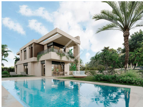
Parcela 14 - Tipología C Vivienda 14C