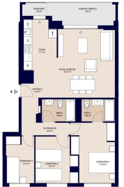
OPCION BASE 1 : 75