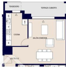
OPCION COCINA CERRADA 1 : 100