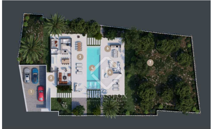
Parking Main Access 3. Semi Covered Terrace 4. Pool 5. Outdoor Living Space 6. Outdoor Kitchen 7. Garden

Belangrijke informatie met betrekking tot onroerend goed aangeboden door Lucas Fox. De gegevens van al het vastgoed maken geen deel uit van een offerte noch van een contract. Er moet niet van verbale of schriftelijke mededelingen uitgegaan worden die Lucas Fox doet over de woning, de conditie of de waarde ervan. Noch Lucas Fox, noch een andere geassocieerde agent heeft het recht om uitspraken te doen over het vastgoed en alle gegeven informatie is geheel zonder verantwoordelijkheid van de agenten, de verkoper(s) of de verhuurder(s). Wij adviseren alle kopers voorafgaande de ondertekening van een document met betrekking tot de woning contact opnemen met een onafhankelijke advocaat en indien een onderzoek doet naar de staat en de afmetingen van de woning. De gegeven locatie, opmetingen en afstanden zijn slechts ter oriëntatie en moeten worden gecontroleerd door de koper.