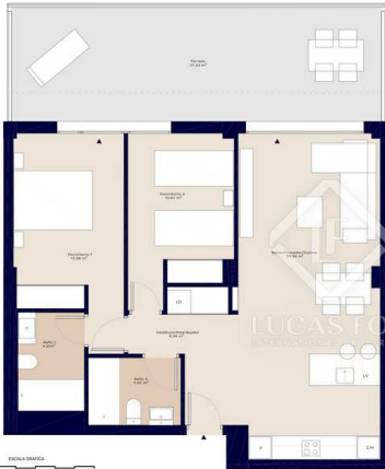
Bloque 1 Esc. 2 P04 D