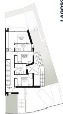
PLANTA PRIMERA FIRST FLOOR